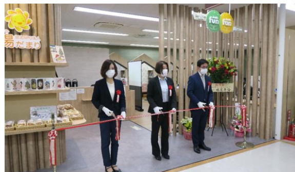
2021年12月10日 オープニングセレモニー