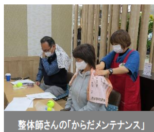
整体師さんの「からだメンテナンス」